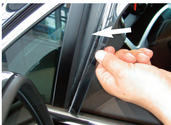
Abb.2 / Fig.2

Push the front end of the milled flange wind deflector into the rubber seal of the window channel at the mirror end. Make sure that the wind deflector is placed onto the horizontal rubber of the door frame (Fig. 2) and does not slip into the window shaft.