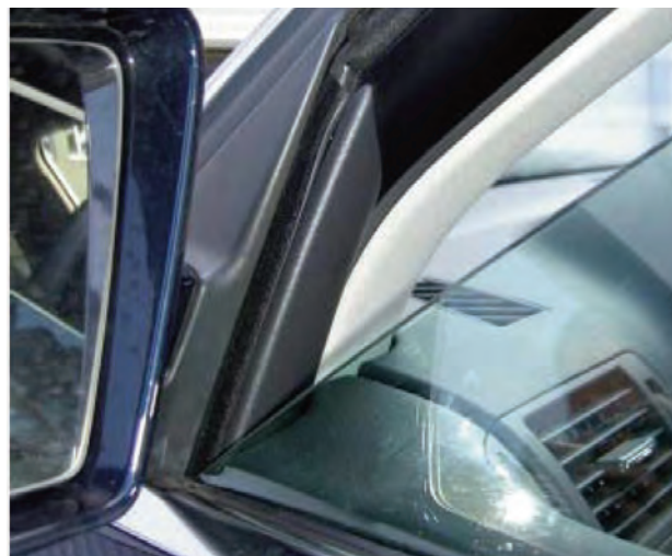
Abb.1 / Fig.1