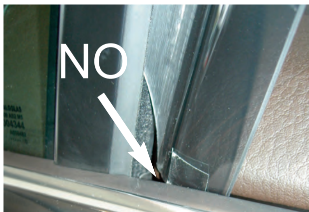
Abb.3 / Fig.3