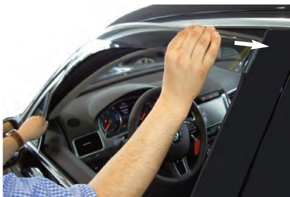
Abb.4 / Fig.4